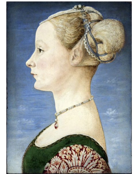
Star des Hauses: „Porträt einer jungen Dame“ von Piero del Pollaiuolo, 1470

Im August 1943 wurde die Mailänder Innenstadt von der britischen Royal Air Force bombardiert, was auch an dem Mu-