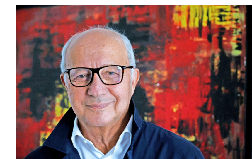
Ist jetzt so frei: Fabius bei der Präsentation seiner Werke

Im vergangenen Jahr hat Fabius eine erste Schau seiner Werke in Shanghai organisiert, weit ab von möglicherweise bösen Zungen im süffisanten Paris. Das Experiment war erfolgreich: alles verkauft. Tatsächlich haben seine Gemälde eine ästhetische Berechtigung, öffentlich gezeigt zu werden. Fabius ist mehr als ein Sonntagsmaler. Zugleich bleibt evident, dass er das große Medienecho und den prompten Käuferzuspruch seiner Karriere und seinem Adressbuch verdankt. Die Einflüsse und Vorlieben in den Sachen Kunst höchst gebildeten Politikern sind sofort zu spüren. 1946 geboren, ist er ein Kind des abstrakten Expressionismus und der lyrischen Abs-